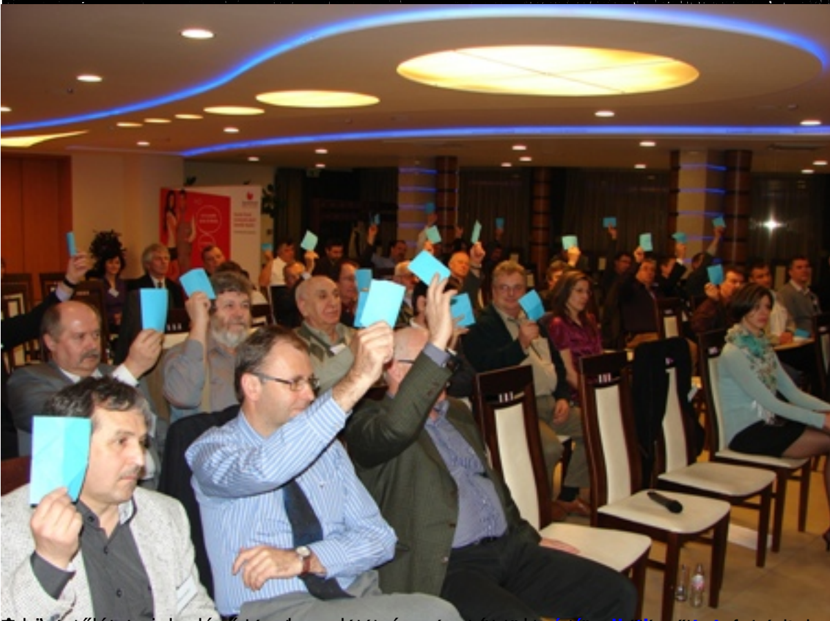
A díjazásra jelentő részlet a cég igazgatója és a zárlógyűlés elnöke tagok el.